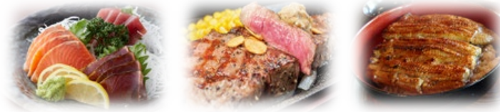
提供メニュー イメージ

メニューは「ステーキ」、「とんかつ」、「寿司」、「うなぎ」など入居者からのアンケートで要望の高いメニューの中から取り入れます。並行して月に1回の外食イベント実施し、食への興味を保つ取り組みを行います。