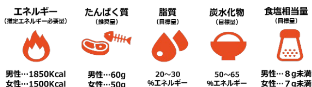
（図1） 70歳以上の1日当たりの栄養摂取量 / 厚生労働省 「日本人の食事摂取基準」2015年版

参加者には、通常提供している食事摂取基準を超えるカロリーとタンパク質の『MOG』プログラムメニューを週1回目安で食べていただきます。