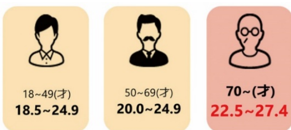
（図2） 観察疫学において報告された総死亡率が最も低いBMI範囲（男女共通）/厚生労働省「日本人の食事摂取基準」2015年版

また、日本人65-79歳BMIと生命予後の研究では、BMI30.0未満はまったく死亡リスクは上昇せず、逆にBMI20.0を下回るとリスクが上昇することが証明されています（図3参照）。